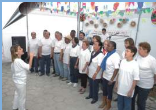
Este ano teve surpresa: apresentação do Coral da AAPS com repertório típico...