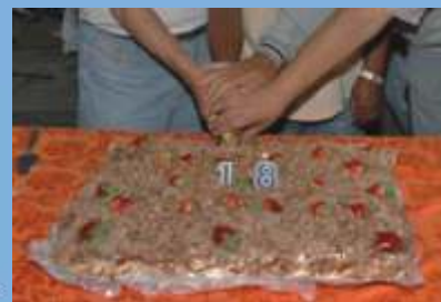
...e comemoração do aniversário de 18 anos da entidade.