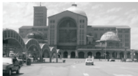
Basílica de Nossa Senhora Aparecida

No dia 16 de fevereiro, pelo terceiro ano consecutivo a AAPS fretou ônibus para viagem à Aparecida. O grupo contou com aproximadamente 60 associados que visitaram a Basílica de Nossa Senhora Aparecida e o Complexo Turístico do Romeiro.