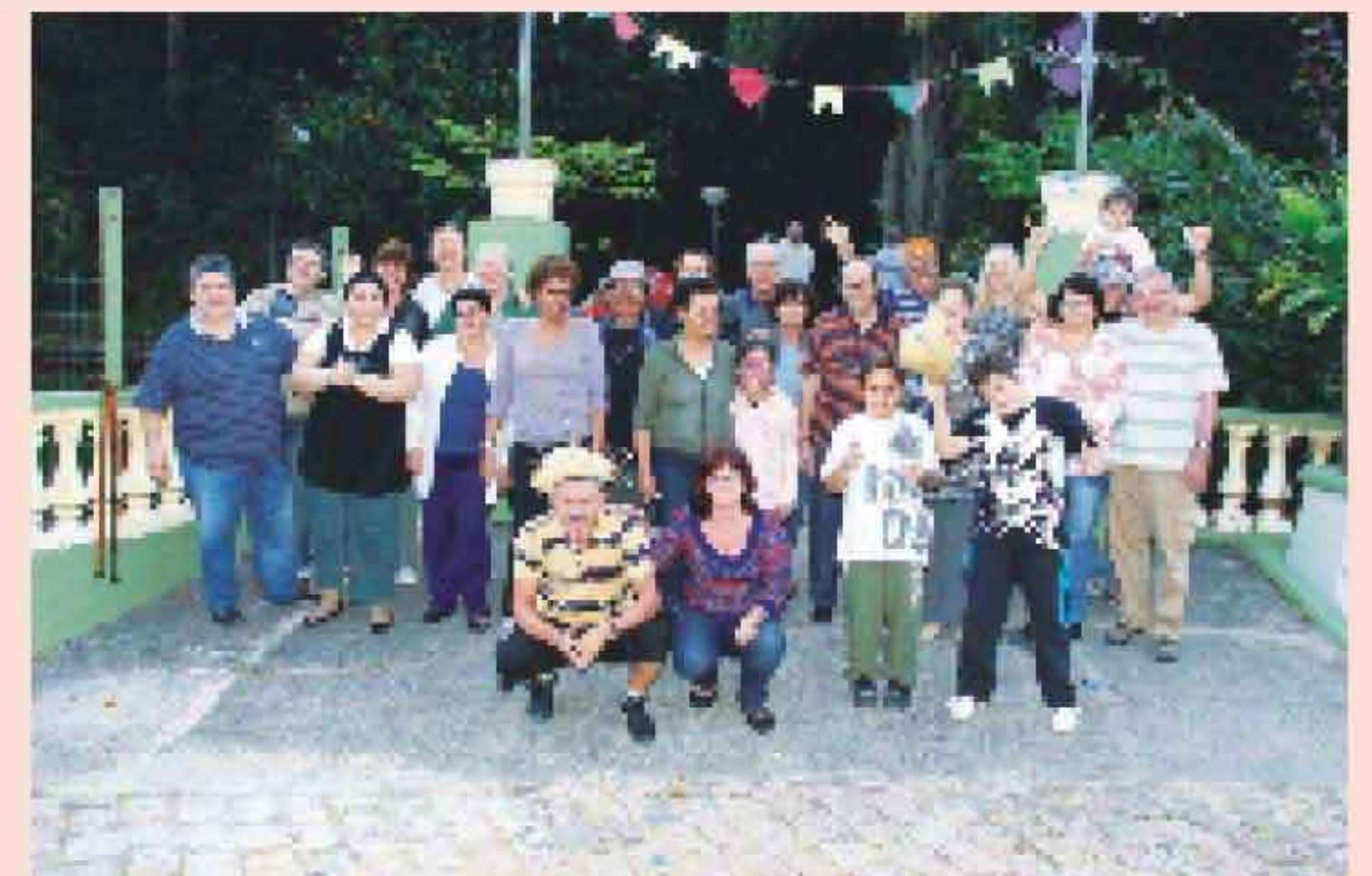
O pessoal da Baixada Santista subiu a serra.