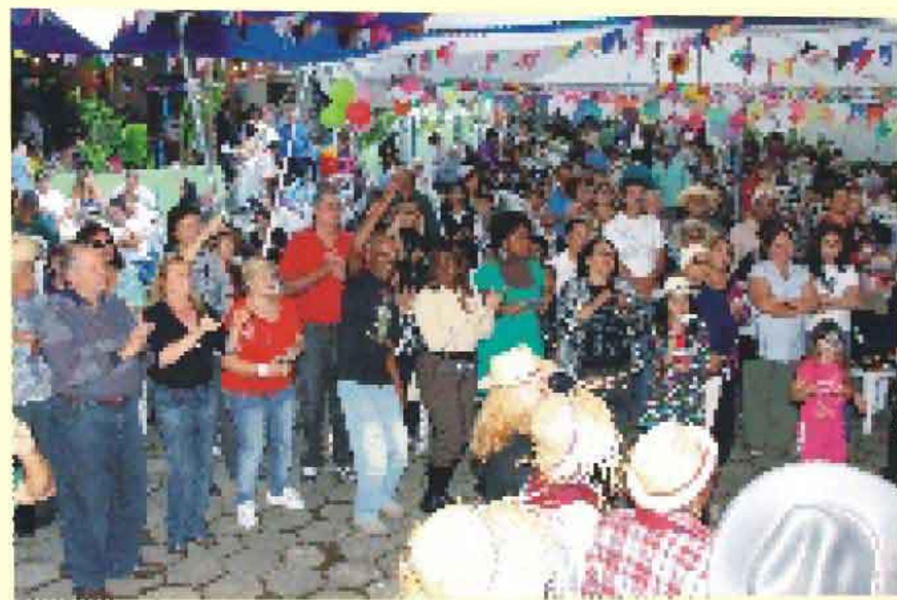
A apresentação do Coral da AAPS ganhou aplausos entusiasmados.