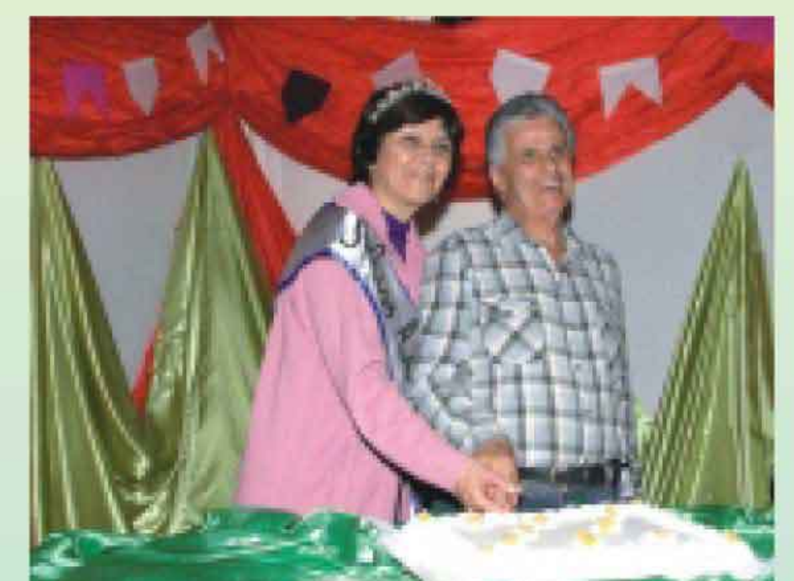
... foi a vez do "Parabéns à você" pelo 20º aniversário da AAPS!