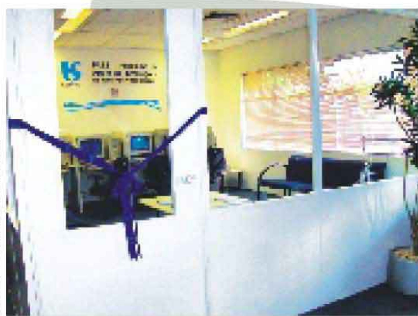
Inauguração da Sala e Espaço Virtual do PAEE