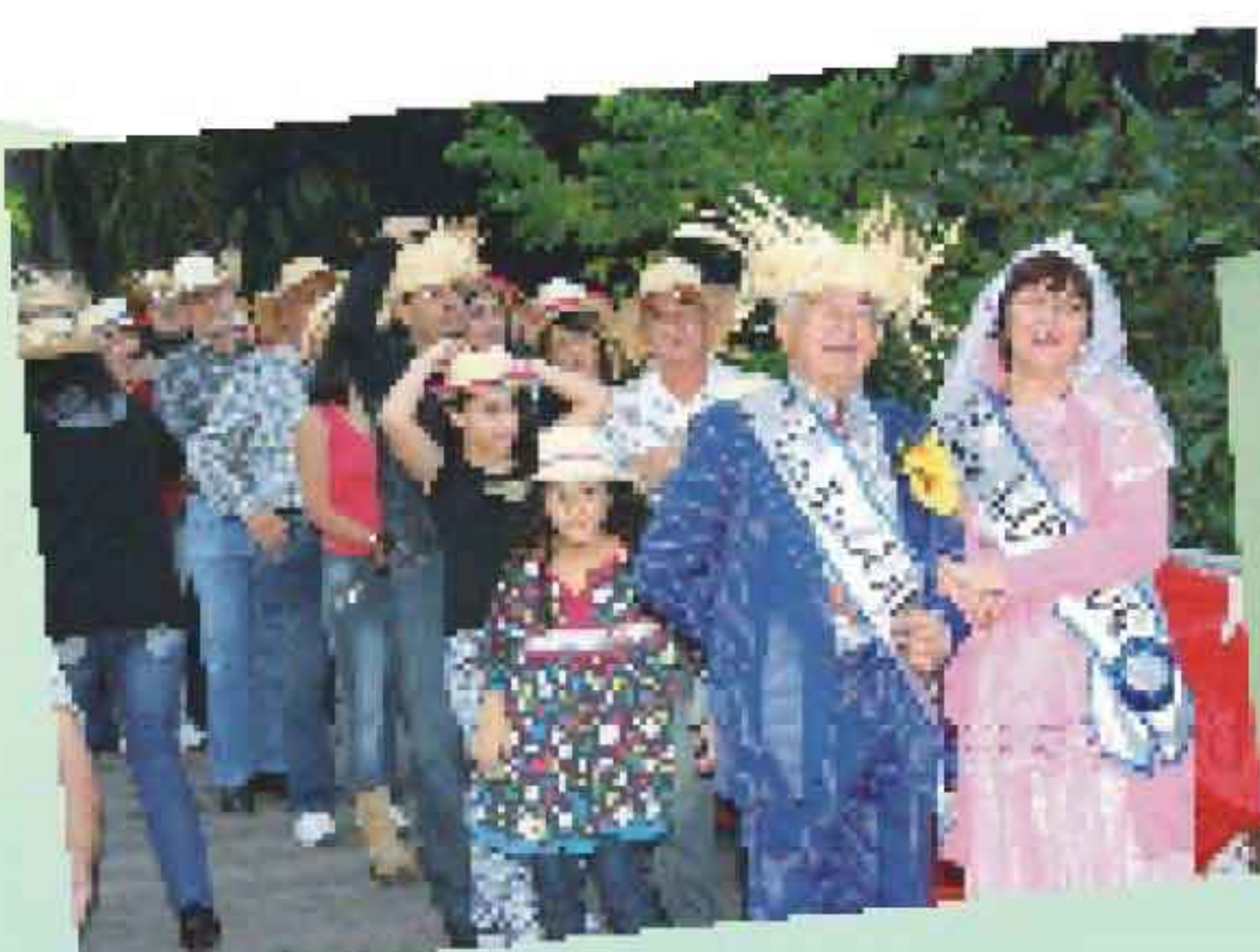
Ao cair da tarde a quadrilha caipira incendiou a festa sob o comando de "Nhô Julião".