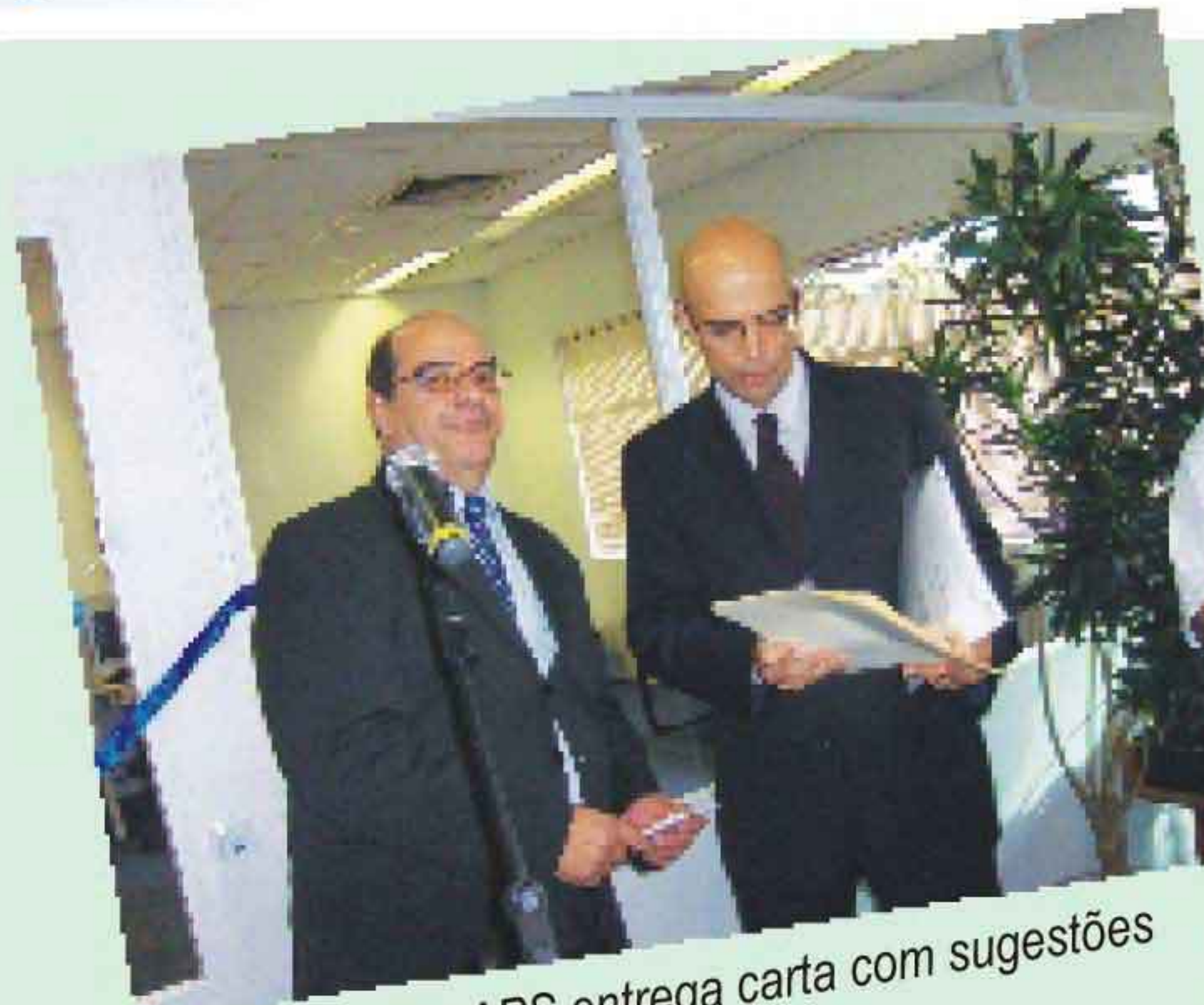
Presidente da AAPS entrega carta com sugestões a Gesner de Oliveira.

No dia 16 de julho, a Sabesp promoveu o lançamento oficial do PAEE - Programa de Apoio ao Empregado e Empreendedorismo - com a inauguração da Sala e Espaço Virtual nas dependências do complexo da empresa na Ponte Pequena. Este programa permitirá o aproveitamento futuro dos profissionais aposentados junto a empreiteiras e parceiros da Sabesp.