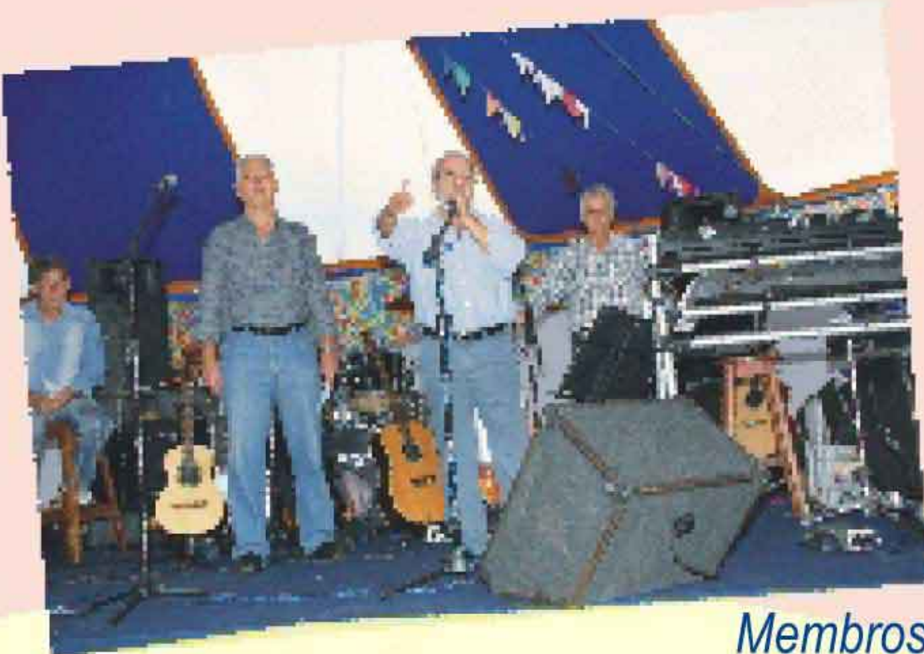
Membros da diretoria saúdam os presentes e anunciam as atrações.

Além do churrasco, acompanhado de buffet de comidas típicas e bebidas, não faltou diversão e animação.